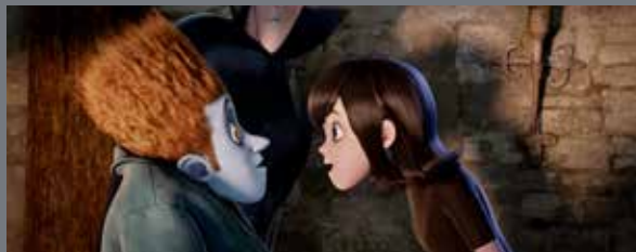
Hotel Transylvania • © 2012 Sony Pictures Animation, Inc. All Rights Reserved.