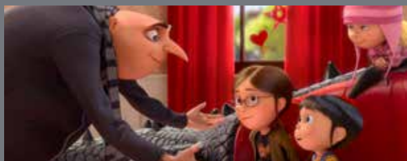
Despicable Me 2 • 2012 Universal Studios