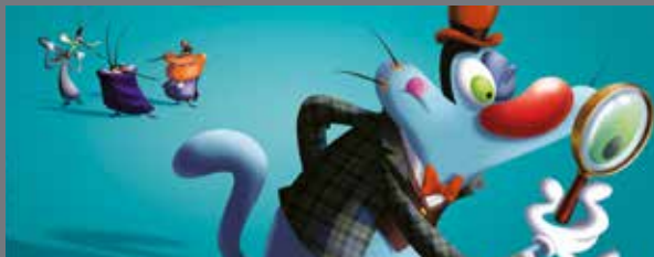
Oggy et les Cafards , le film • Xilam Animation - France 3 Cinéma - Les Films du Gorak