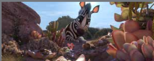
Khumba • Triggerfish Animation